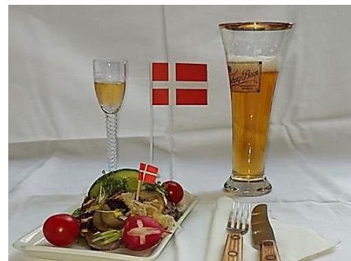
Smørrebrød, øl og snaps. Mittags bleibt die Küche kalt.