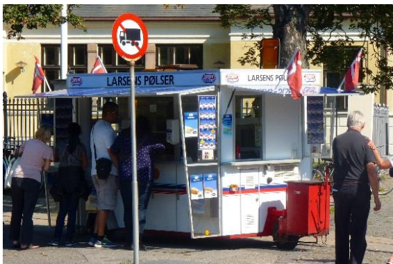
Der Pølsevogn. Mobile Imbissbude für den kleinen Hunger zwischendurch.

Wichtiger Hinweis: Wir werden uns überwiegend zu Fuß durch Kopenhagen und die Umgebung bewegen. Die Reise ist deshalb für Personen mit Bewegungseinschränkungen nicht geeignet.